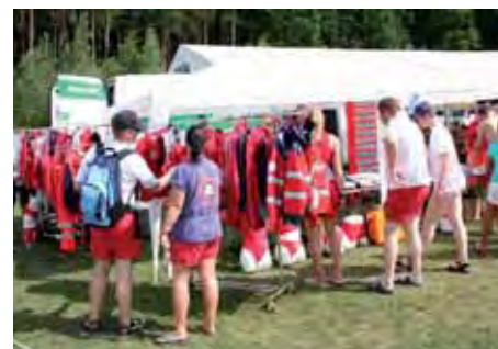
Großes Interesse bestand bei der Einsatzkleidung bei allen Firmen