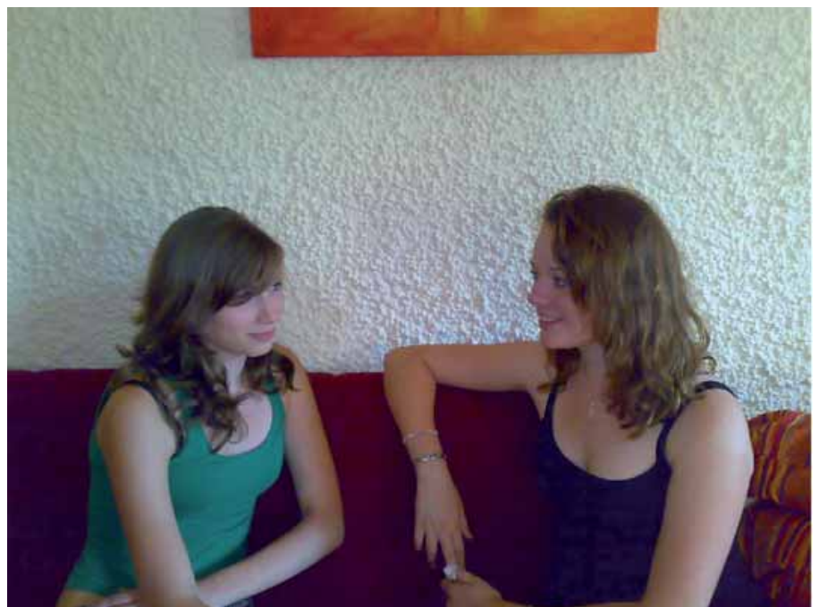
Die beiden Lebensretterinnen im Gespräch

Selbstverständlich befinden sich beide jungen Damen in psychologischer Nachbetreuung des BRK-Kreisverbandes.