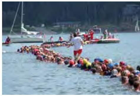
Titelfoto: Weltrekord Guinnessbuch 2008