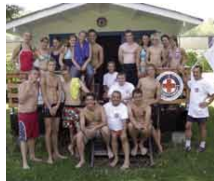
Foto: Auf dem Bild die Ausbilder der Neuburger Wasserwacht und die 17 Jugendlichen vom Camp

Vom 03. - 17. August waren (wie bereits im vergangenen Jahr) Jugendliche aus der ganzen Welt zu Gast auf dem Zeltplatz „Schwaighölzl“ bei Neuburg. Auf dem Programm stand auch heuer wieder eine Ausbildung zum Rettungsschwimmer. 12 Jugendliche erwarben das Deutsche Rettungsschwimmabzeichen in Bronze und 5 das Abzeichen in Silber. Die Mädchen und Jungen waren alle im Alter zwischen 13 und 17 Jahren und kamen aus Deutschland, Portugal und dem Emirat Dubai.